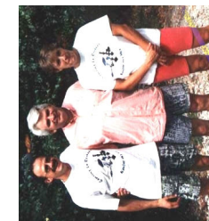
Le Champion du Monde Boris Spassky à « La Rochade »